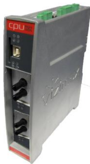
RWK000016F (avec 2 ports fibre optique)