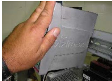
FIGURE 1 Montage sur rail DIN